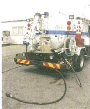
長いパイプを排水管まで下ろし、中の詰まりを勢よく洗浄する高圧洗浄車

私たちの主な事業は、電気工事、水道工事、道路の修復、下水道のメンテナンスです。ほとんどが公共事業や民間企業からの受注によつて仕事が発生する言わば受身の仕事なのですが、受注件数には変動があるため、毎年経営の見通しを立てるのが難しい状況でした。そこで、地下の配管内の状況を調査・診断ができる機材を購入し、調査に基づいたサービスの提案による営業活動を行い、安定